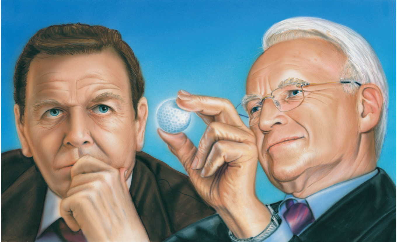
Bild oben: Messeplakat „Schröder und Stoiber“ Kunde: Mannesmann Bild rechts: „NASAnta“, Eigenwerbung, Ölfarben auf Karton.

Die hier dargestellten Personen sind in Airbrush-Mischtechnik und Ölfarben erstellt worden.